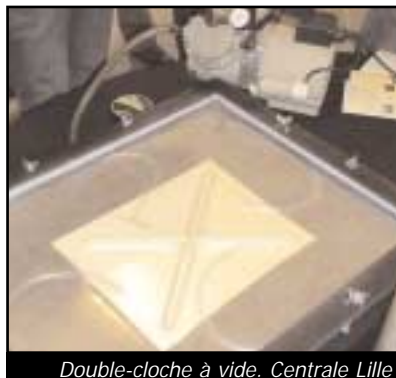
Double-cloche à vide. Centrale Lille