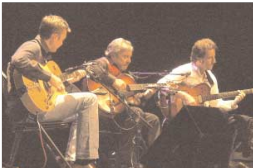
Nouveau Trio Gitan

www.philipcatherine.com www.christianescoude.com