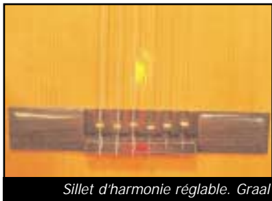
Sillet d'harmonie réglable. Graal

Tout d'abord, chez Graal, un luthier italien qui a adapté sur certaines de ses guitares classiques des sillots séparés et réglables par corde. Ce procédé souvent utilisé sur les guitares électriques, comme le modèle Les Paul de Gibson, n'avait pas encore atteint la guitare classique. L'intérêt de cette technique est de gagner en précision sur chaque note.